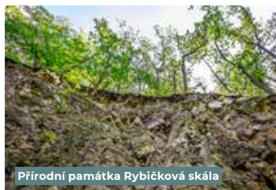
Přírodní památka Rybičková skála