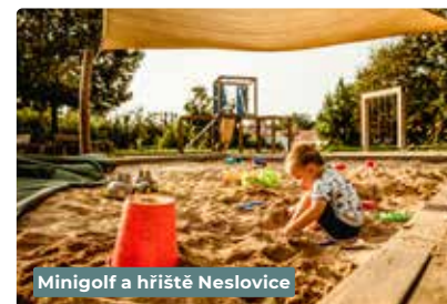
Minigolf a hřiště Neslovice