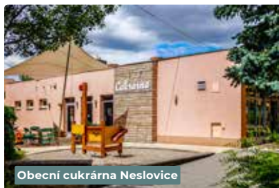
Obecní cukrárna Neslovice