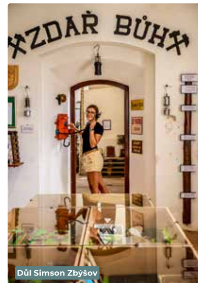
Důl Simson Zbýšov