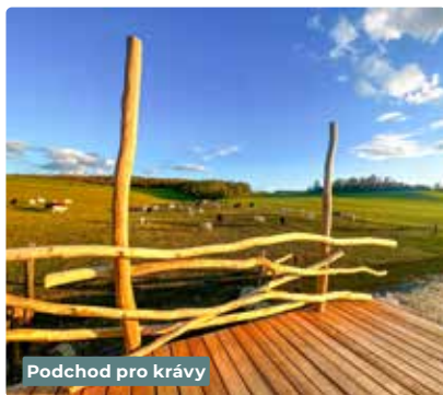
Podchod pro krávy