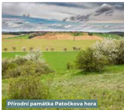
Přírodní památka Patočkova hora